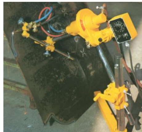
Onder een hoek snijden