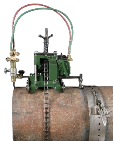
Опция направляющий рельс даёт высокое качество резки, подходит для больших труб. Каждый направляющий рельс оснащён дополнительными звеньями цепи для большего диаметра.