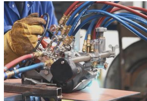
Simple acción encendido/apagado del gas