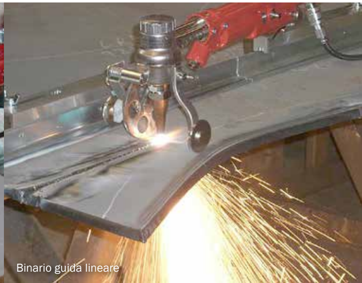
Binario guida lineare