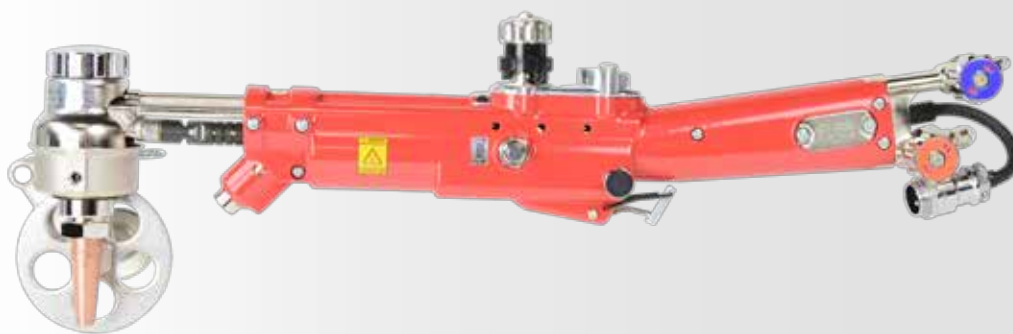
Handy Auto Plus