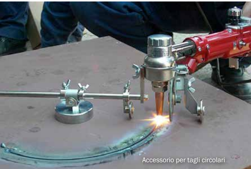
Accessorio per tagli circolari